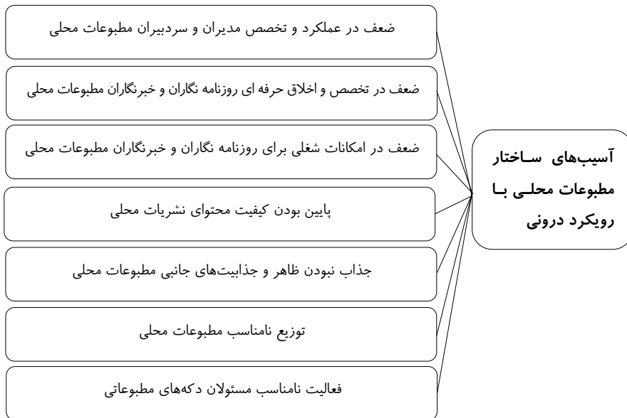
شکل ۱. تجارب فعالان مطبوعاتی از آسیب‌های ساختار مطبوعات محلی با رویکرد درونی

یافته‌های پژوهش در دو دسته‌بندی درونی و برونی قرار گرفت که مفهوم‌های هر کدام به طور مشخص به دست آمده است.