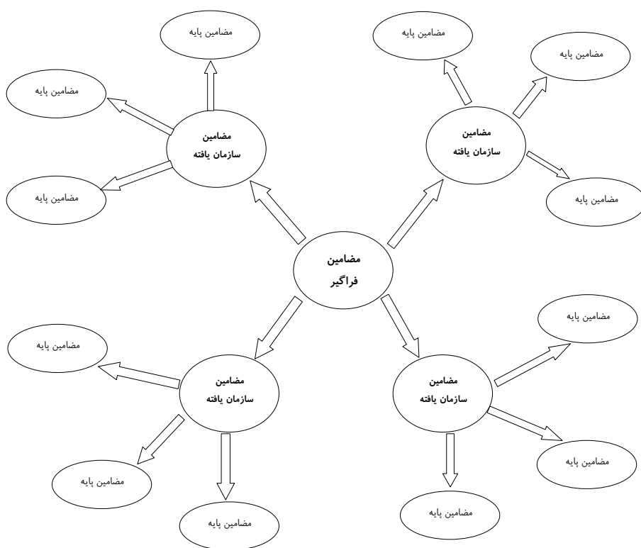
شکل ۲. ارتباط شبکه ایی انواع مضمون ها با یکدیگر

ج. کشف مضمون‌های فراگیر (مضامین عالی در برگزیده اصول حاکم بر متن به عنوان یک کل) بعد از طی این مراحل، مضمون‌های به دست آمده به صورت نقشه‌های شبکه وب ترسیم می‌شوند که در آن مضامین برجسته همراه با روابط میان آنها مانند شکل ۲ نشان داده می‌شود: