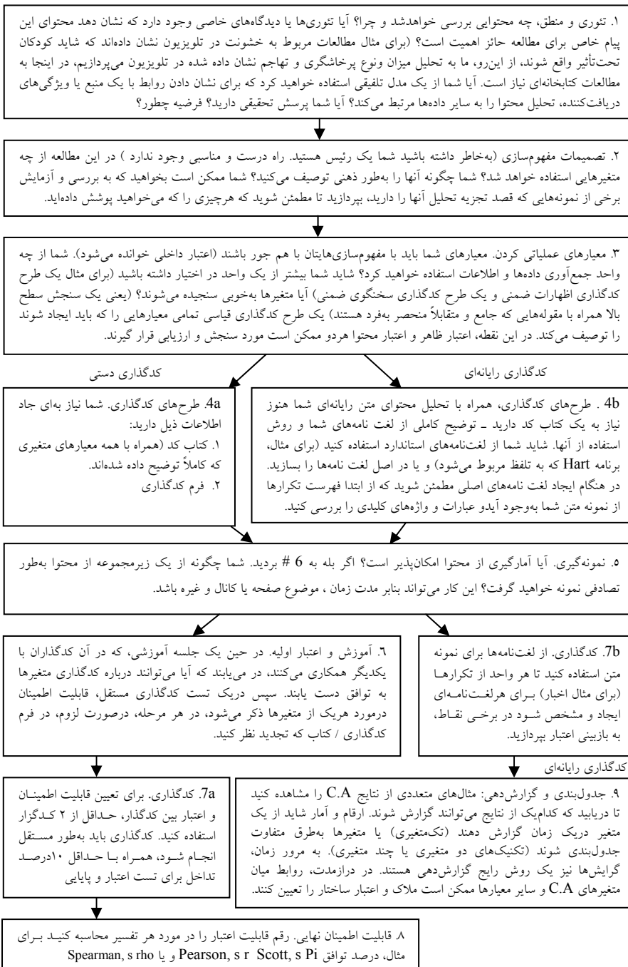
شکل ۱ فلوچارت فرایند خاص تحقیق تحلیل محتوا