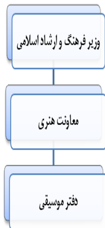
نمودار ۱ جایگاه سازمانی دفتر موسیقی

دفتر موسیقی معاونت امور هنری وزارت فرهنگ و ارشاد اسلامی در واقع عنوان متولی اصلی سیاستگذاری‌های حوزه موسیقی کشور است. شکل ساده زیر جایگاه سازمانی این دفتر را نشان می‌دهد.