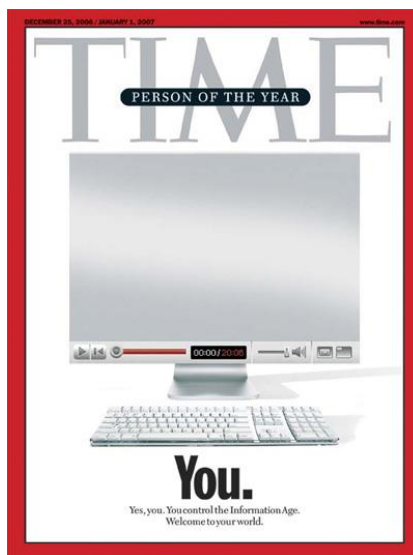
شکل ۱. شخص سال مجلهٔ تایم در سال ۲۰۰۶ میلادی

محتوای تولید کاربر، برای طیف گسترده‌ای از موضوع‌ها از جمله اخبار، سرگرمی، تبلیغات و ... استفاده می‌شود که نمونه‌ای از دموکراتیزه کردن تولید محتوا است؛ چراکه در آن هیچ دروازه‌بانی، مانند آنچه سردبیران روزنامه‌ها و ناشران قبل از انتشار دارند، وجود ندارد. عموم مردم از طریق فناوری‌های جدید، به اطلاعات بیشتری بدون فیلتر دسترسی دارند و با تغییر مخاطب منفعّل از فرصت‌های تعاملی استفاده کرده و به عنوان رسانه شهروند (Citizen media) دارای بازخورد و پوشش خبری هستند. (OECD, 2007)